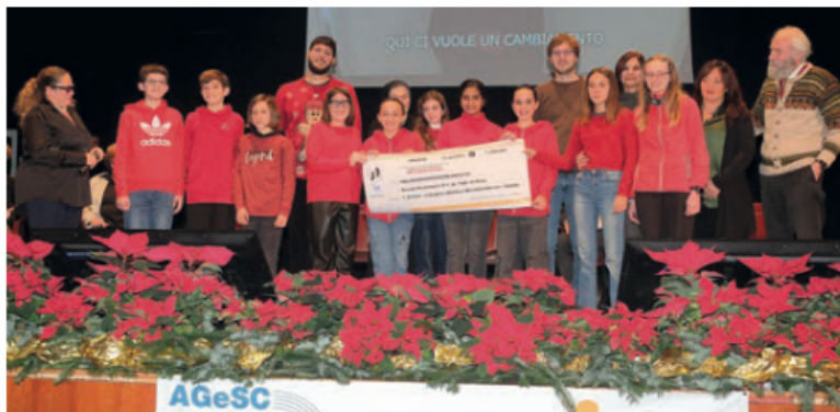
Una delle scuole premiate venerdì 15 dicembre per il concorso “Maria Luisa Dal Castello”